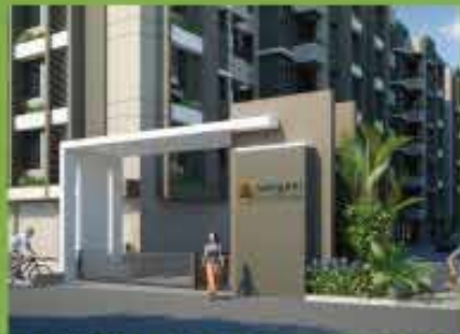
ENTRANCE GATE WITH SECURITY